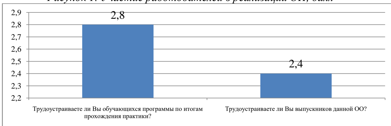
Рисунок 2 Участие работодателей в трудоустройстве выпускников данной ОО, балл